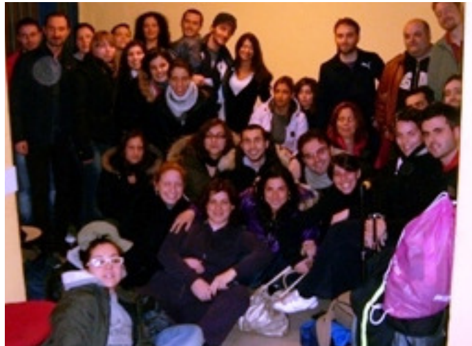
Corso di Idrokinesiterapia Roma 2009 2° edizione