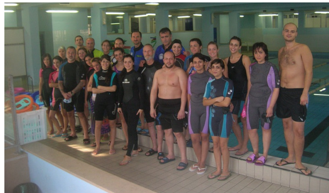
Corso Roma 2° Edizione 2008