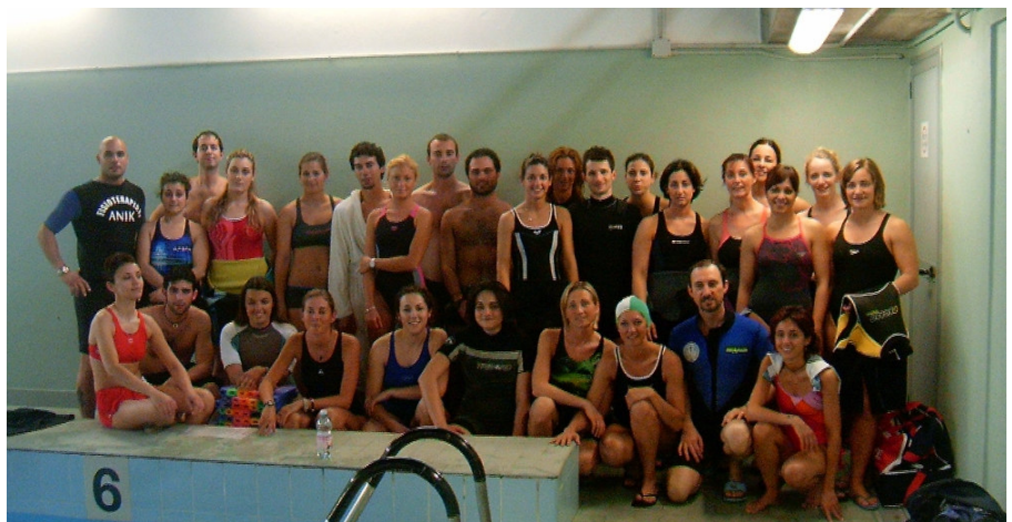
Gruppo Corso di Idrokinesiterapia Bologna 2008