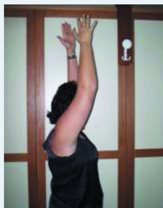
Foto 1-Esempio di paziente con grosso braccio Il linfedema è una patologia tutt'ora poco conosciuta e pertanto non considerata in tutti i suoi aspetti. Se prendiamo in considerazione un paziente con linfedema oltre all'edema che caratterizza il gonfiore dell'arto o degli arti, si

L'importanza dell'assistenza riabilitativa per patologie vascolari nasce dal fatto che oltre ad essere invalidanti, sono quasi sempre croniche, spesso ingravescenti se non trattate e hanno un forte impatto psicologico sulla persona a causa del danno estetico e soprattutto funzionale che causano.